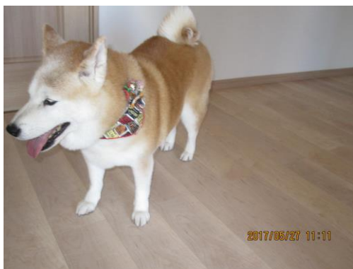
ジャンは関係なく赤ちゃん帰りになった甘えん坊のふく