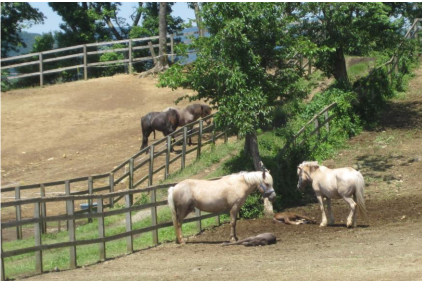
長々と眠りこけている2頭の仔馬