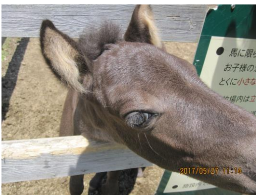
眠りから覚めるとこんなに人懐っこく寄ってくるリンリン